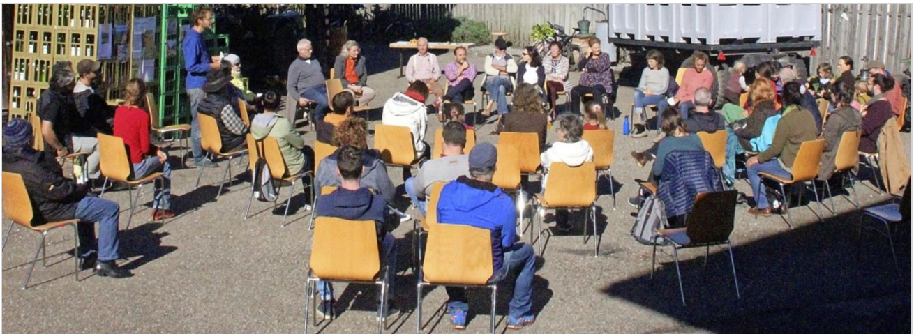
Am ersten Informationstreffen zur Solidarischen Landwirtschaft nahmen 50 Interessenten teil.

Gemeinschaftlich produzieren und verbrauchen ist das Ziel der Solidarischer Landwirtschaft (Solawi). Beim ersten öffentlichen Treffen sind am Samstagnachmittag rund 50 Personen ins Weingut Joachim Jäger in Ettenheimweiler gekommen. Das Treffen sollte erste Informationen liefern.